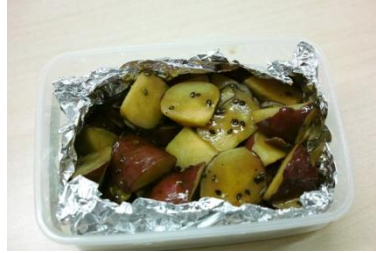
「サツマイモを調理したもの」B