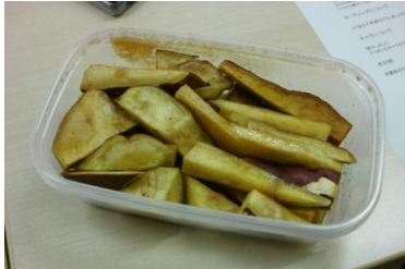
「サツマイモを調理したもの」A