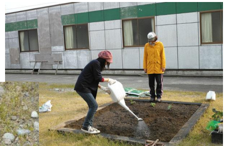
v(。・ω。.)イエィ♪ (*^_^*)v イェィ♪