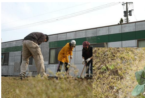
＼(・▽・*)ノキャッキヤ ＼(*'▽`)/ キャッホー!!

となりました。この中で BBQ にふさわしく、あるいは、つくりやすいものが、 2 つ選ばれましたあああ。その他、 4 つは フランター でえええ。集まったメンバーが少なかったのですが、買い出しから、耕しから、植え付けから、水やりまで、きびきびとおお。途中、スーツでK先生も手伝ってくれましたあああ。ありがとうございますううう。順調に育つといいのですがあああああああああああああ-----。